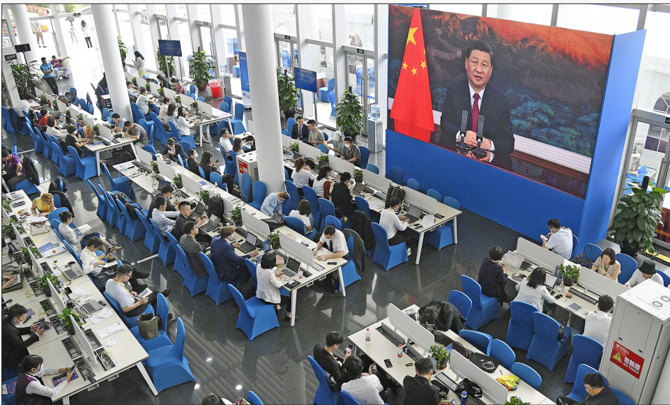
GSI အစီအမံကို အဆိုပြုခဲ့သည့် ဘိုးအောက်ဖိုရမ် (၂၀၂၂) အဖွင့်မိန့်ခွန်းကို အွန်လိုင်းမှတစ်ဆင့် ပြောကြားခဲ့သည့် တရုတ်သမ္မတ ရှီကျင့်ရှင်

အနောက်နိုင်ငံတွေ ဦးဆောင်တဲ့ ကမ္ဘာလုံးဆိုင်ရာ စီမံအုပ်ချုပ်မှုအထိုင်ကို အားပြိုင်ဖို့ တရုတ်နိုင်ငံဟာ ကမ္ဘာလုံးဆိုင်ရာလုံခြုံရေးအစီအမံ (GSI) ကို တွန်းတင်လာပါတယ်။ ဒီ အစီအမံကို မြန်မာအပါအဝင် မဲခေါင်ဒေသတွင်း နိုင်ငံတွေမှာ ကနဦးဖော်ဆောင်ဖို့ လုံခြုံရေးကဏ္ဍစုံနဲ့ စတင် ချိတ်ဆက်နေပါတယ်။ ရိုဟင်ဂျာပြဿနာနဲ့ လက်နက်ကိုင်ပဋိပက္ခကို ဖြေရှင်းနေရတဲ့ စစ်ကောင်စီကလည်း ပြည်တွင်းရေးနဲ့ အချုပ်အခြာအာဏာဆိုတဲ့ အခြေခံအပေါ် ရပ်တည်ပြီး ဒီအစီအမံကို ထောက်ခံထားပါတယ်။ လက်ရှိမှာလည်း လန်ချန်း-မဲခေါင် ပူးပေါင်းဆောင်ရွက်ရေးအစီအမံ (LMC) နဲ့တွဲစပ်ပြီး တရုတ်နိုင်ငံဟာ စစ်ကောင်စီအပါအဝင် ထိုင်း၊ လာအိုအစိုးရတွေနဲ့ ပူးပေါင်းပြီး နိုင်ငံဖြတ်ကျော်မှုခင်းတွေကို စတင်နှိမ်နင်းနေပါတယ်။ မြန်မာနိုင်ငံရေးပဋိပက္ခ၊ အာဆီယံမညီညွတ်မှုနဲ့ တရုတ်ဩဇာကြီးထွားလာမှုတို့အကြား GSI ဟာ စောင့်ကြည့်ရမယ့် အစီအမံတခု ဖြစ်လာပါတယ်။