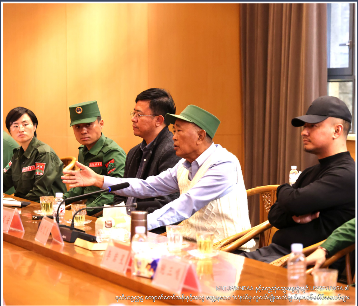
MNTJF/MNDAA နှင့်တွေ့ဆုံဆွေးနွေးပွဲတွင် UWSP/UWSA ၏

မြန်မာ့လက်နက်ကိုင် ပဋိပက္ခအတွင်း ပါဝင်နေကြသော ဘက်အသီးသီးနှင့် အိမ်နီးချင်းနိုင်ငံများအတွက် အလေးထားစောင့်ကြည့်ရမည့် အခြေအနေဖြစ်သည်။